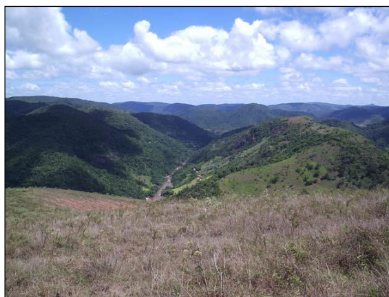
Figura 2 - Visão panorâmica do vale do rio Guanhões, na área de entorno da PCH Senhora do Porto.